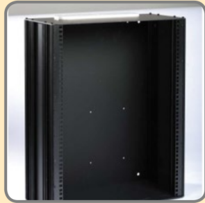
Gehäuse 19" 12HE mit/ ohne Schwenkrahmen(SR)