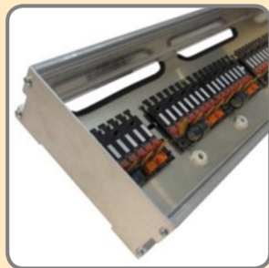
Beispiel Gehäuse INTEGRA MFB bestückt mit SR